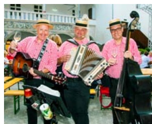
Das Quatschbergecho verwöhnte uns mit vielen musikalischen „Ohrwürmern“